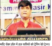
मॉडर्न चेंबर हॉल में हज जायरीनों को हरीया देवे देरु।

कानपुर (एसएनबी)। हज कमेटी ऑफ इंडिया को और से हज जायरीनों के लिए प्रशिक्षण शिविर का आयोजन किया गया। शिविर में हज जायरीनों को प्रशिक्षण देने के अलावा सुधारकों व दयाओं की किट का वितरण किया गया।