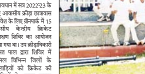
क्रिकेट प्रशिक्षण शिविर में प्रमाणपत्र प्राप्त करने वाले खिलाड़ी।