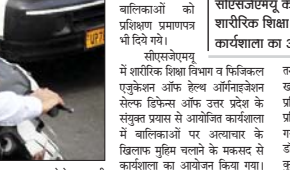
सीएसजेएमयू के शारीरिक शिक्षा विभाग में कार्यवाहता का आयोजन

सहारा न्यूज ब्यूरो कानपुर। छात्राओं को निरंतर परिस्थितियों में हीसला बचकर रहने और धैर्य के साथ सामना करने के गुरु सिखाये से बचने के लिये प्री प्लानिंग करने की जरूरत है।