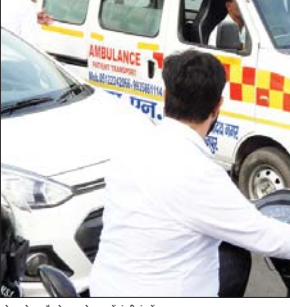
कोसकौला साईपै पर लेने जाय में चली छुट्टी।